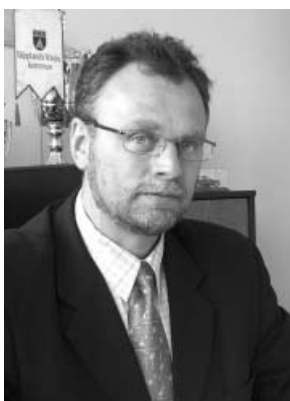
Burmistrz Miasta i Gminy Piaseczno

Zobowiązujemy się do rzetelnej pracy, aby budżet zrealizowany został zgodnie z przyjętym planem.