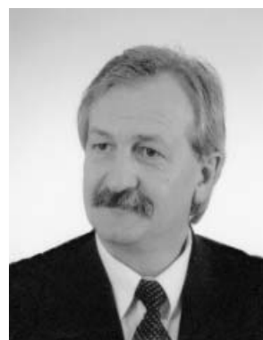
Przewodniczący Rady Miejskiej w Piasecznie