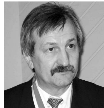
Przewodniczący Rady Miejskiej

Dziękując burmistrzowi i Radzie Miejskiej za duży wysiłek włożony w ostateczny kształt budżetu, życzę aby jego realizacja przebiegała bez żadnych podchodów i zawirowań, a energia była skierowana na rozwiązywanie bieżących problemów naszych mieszkańców.