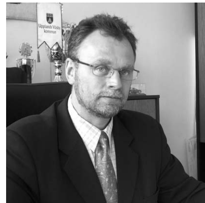
Burmistrz Miasta i Gminy Piaseczno

Przy realizacji części zadań inwestycyjnych planujemy wykorzystywać środki pochodzące z programów Unii Europejskiej