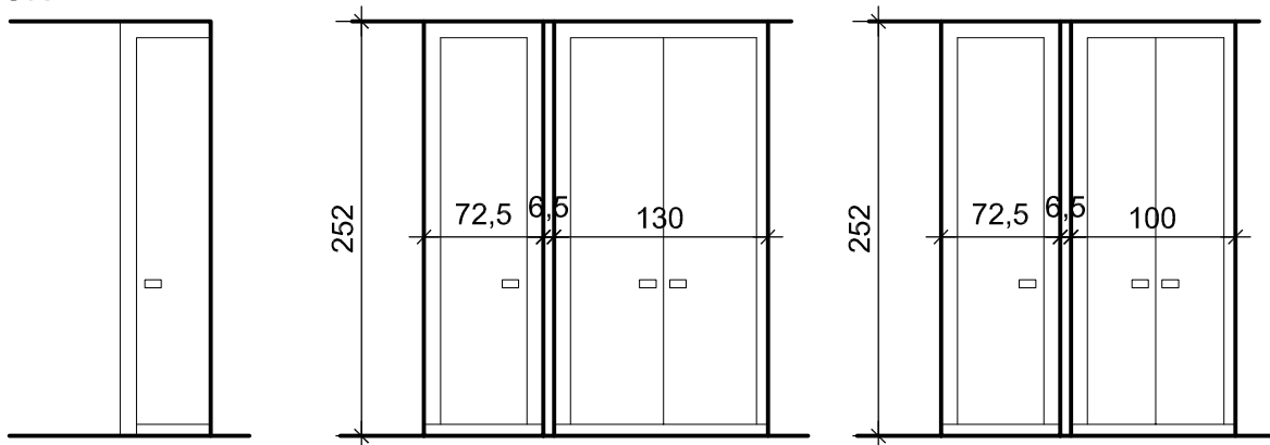
OBUDOWA SZACHTU ELEKTRYCZNEGO-3szt