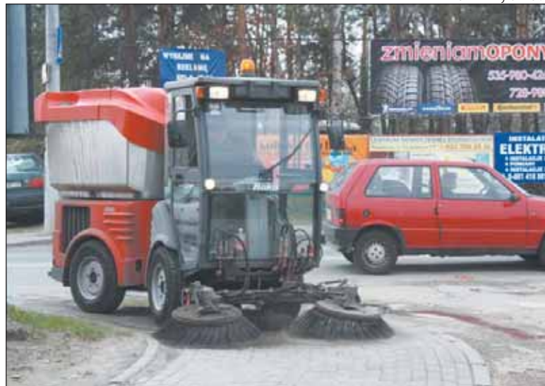
Zmiatarka potrafi w godzinę sprzątnąć 5 km chodnika

Prowadzone jest także przez PUK SITA doczyszczanie pozimowe chodników i ulic w ramach zawartej z gminą umowy. Na terenach nie objętych porozumieniem piasek i brud z chodników i krawężników usuwa wynajęta przez Wydział UTP zmiatarka Citymaster 1200. Pracując na trzy zmiany, praktycznie całą dobę, jest w stanie w ciągu dwóch dni wysprzątać na sucho i na mokro kilkanaście kilometrów chodnika. Oczyszczony został już teren części Józefostawia, a także okolice ulic Żeromskiego, Staszica, Wojska Polskiego, Dworcowej i Sienkiewicza. Za-