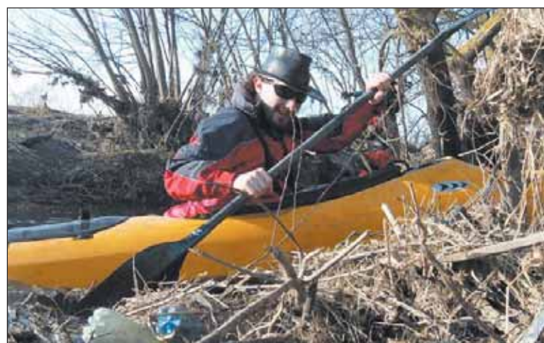
Pierwsza akcja sprzątnięcia Jeziorki przez kajakarzy

Do udziału w kolejnych edycjach sprzątnięcia Jeziorki zapraszamy również