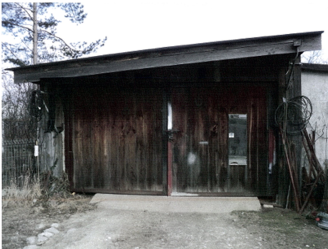
GARAŻ - ELEWACJA ZACHODNIA