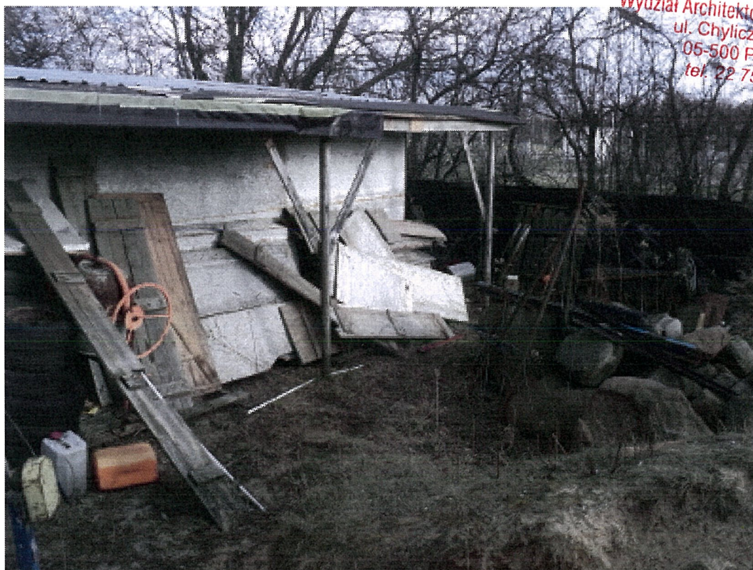
BUDYNEK GOSPODARCZO - GARAŻOWY - ELEWACJA PÓŁDNIOWA