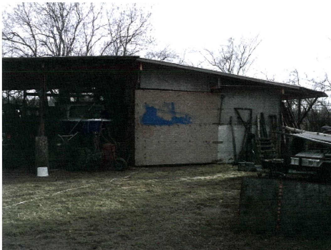
BUDYNEK GOSPODARCZO - GARAŻOWY - ELEWACJA ZACHODNIA