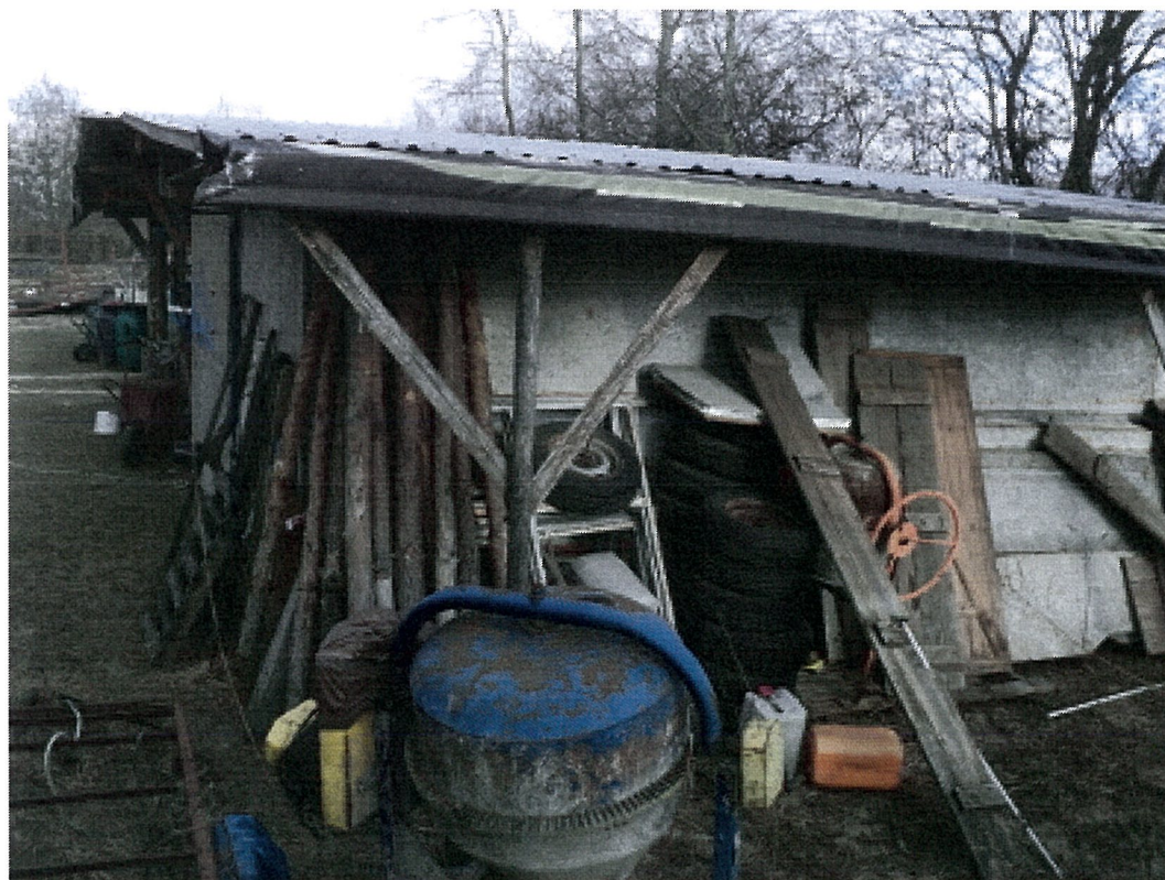
BUDYNEK GOSPODARCZO - GARAŻOWY - ELEWACJA PÓŁUDNIOWA