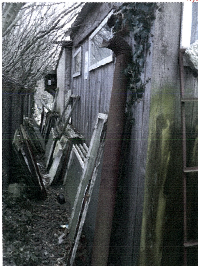
GARAŻ ELEWACJA WSCHODNIA