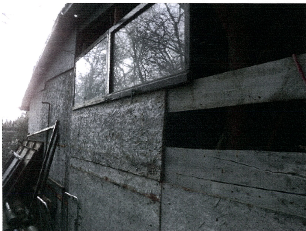
BUDYNEK GOSPODARCZO - GARAŻOWY - ELEWACJA WSCHODNIA