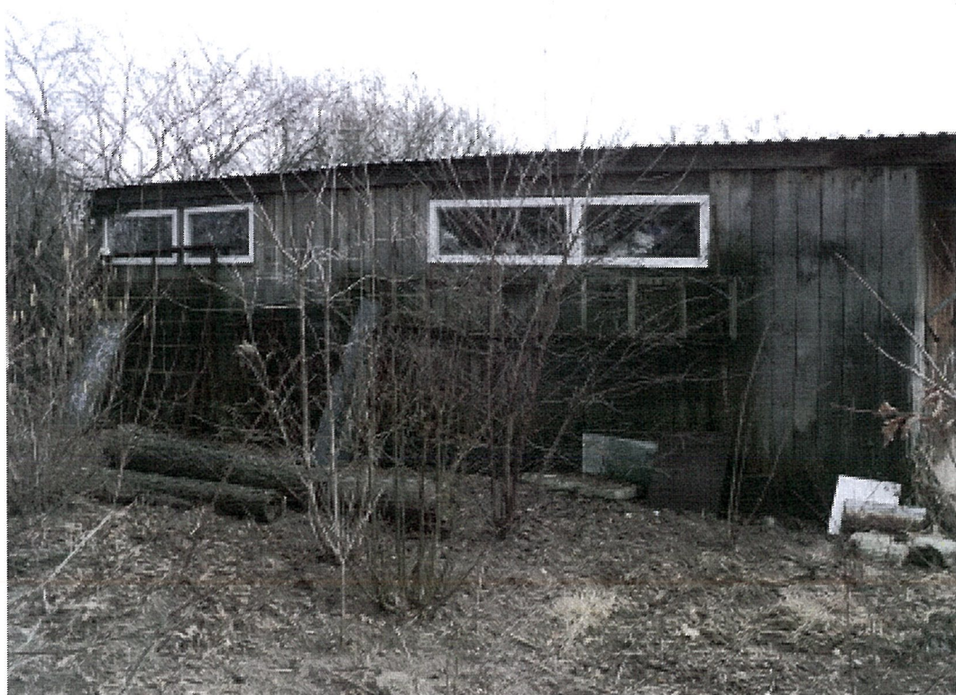
GARAŻ - ELEWACJA PÓŁNOCNA