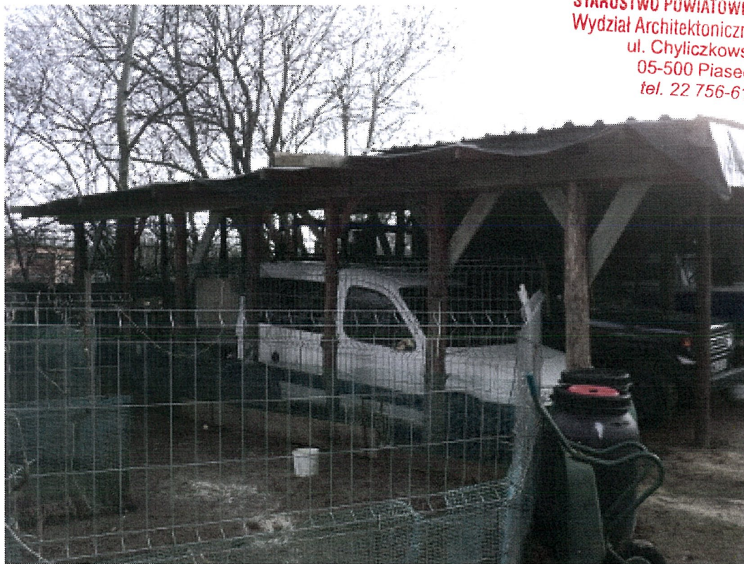
BUDYNEK GOSPODARCZO - GARAŻOWY - ELEWACJA PÓŁNOCNA

STAROSTWO POWIATOWE W PIASECZNIE Wydział Architektoniczno-Budowlany ul. Chyliczkowska 14 05-500 Piaseczno tel. 22 756-61-63