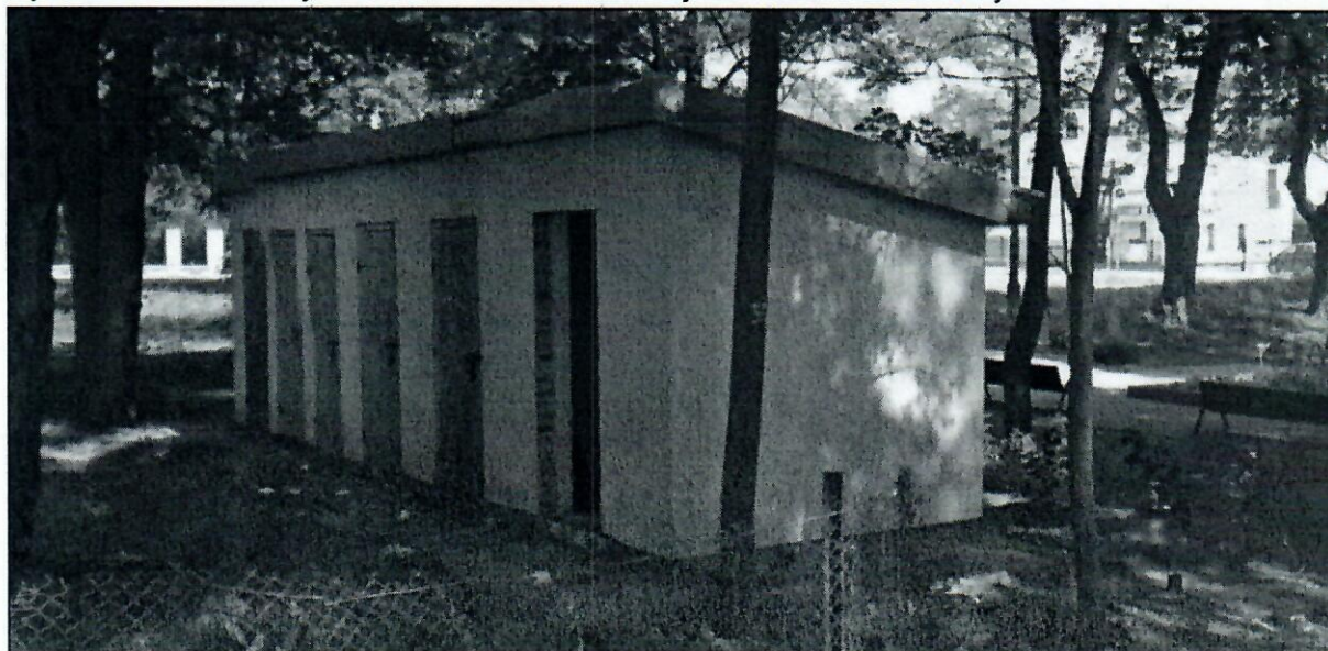
Fot nr 2. Budynek gospodarczy (budynek nr 2)