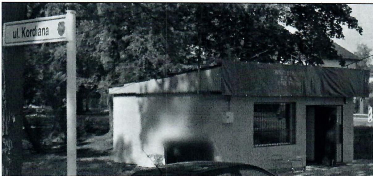
Fot nr 1. Budynek handlowy (budynek nr 1)