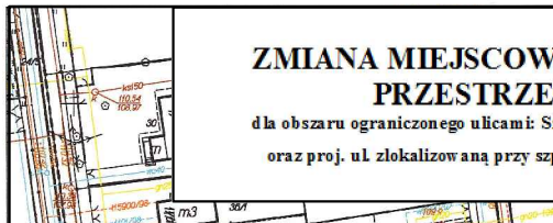
Wyciąg ze Studium Uwarunkowań i Kierunków Zagospodarowania Przestrzennego Miasta i Gminy Piaseczno