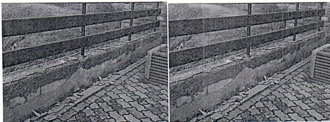
Murek przy 3 Placach.