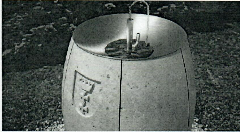
Poidelko w Gdańsku