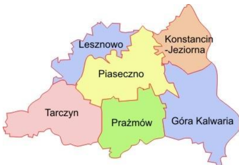
Rysunek 1. Gmina Piaseczno na tle Powiatu Piaseczyńskiego