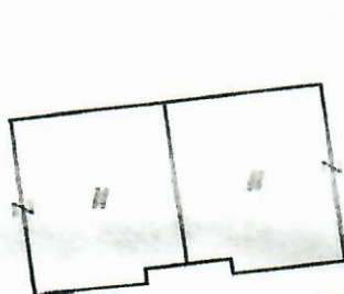
KW VIII 11027