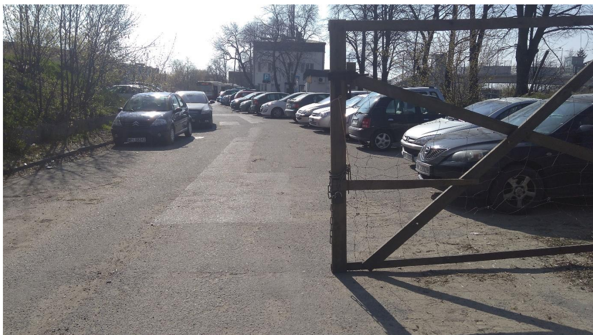
Zdj. 1 Pojazdy parkujące obok dworca PKP.

Projektowana ulica Towarowa, znajdująca się na działce nr 1/6 (obręb 0037), zgodnie z MPZP (teren oznaczony jako KK) na odcinku od ul. Nadarzyńskiej do ul. Dworcowej zlokalizowana jest na terenach kolejowych PKP. Jest to teren przyległy do linii kolejowej nr 8 Warszawa Zachodnia – Kraków Główny. W stanie istniejącym obszar ulicy Towarowej w przeważającej części został przeznaczony pod plac budowy związany z modernizacją linii kolejowej nr 8. W rejonie skrzyżowania z ulicą Dworcową odbywa się nieuporządkowany postój pojazdów uwarunkowany bliskością dworca PKP Piaseczno. Ulica posiada odcinkowy chodnik o nawierzchni bitumicznej i szerokości około 2,0 m, który jest blokowany przez parkujące samochody.