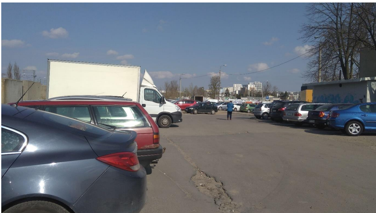
Zdj.2 Pojazdy parkujące w okolicy ul. Nadarzyńskiej.

Ul . Towarowa na całej długości posiada nawierzchnię bitumiczną o zmiennej szerokości. Nawierzchnia ta posiada liczne ubytki i wymaga gruntownego remontu. Droga jest ogólnie dostępna i charakteryzuje się niedużym natężeniem ruchu, umożliwia dojazd do pobliskich posesji. Obecnie teren służy także do obsługi bocznicy kolejowej oraz jako skład materiałów budowlanych.