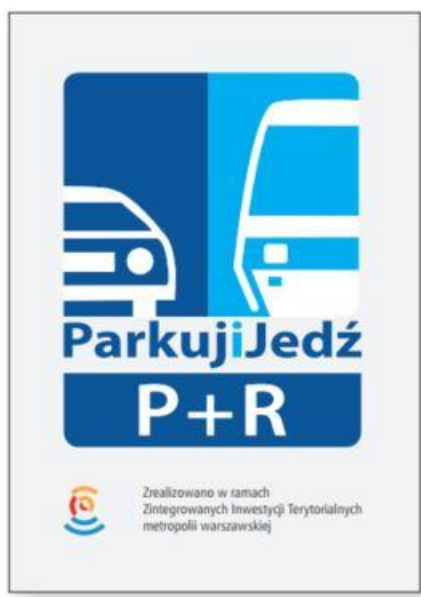
RYSUNEK 1 PRZYKŁADOWA TABLICZKA ZIT

Przykładowa tabliczka ZIT została przedstawiona na rysunku poniżej.