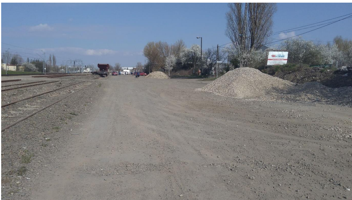
Zdj. 3 Bocznica kolejowa przylegająca do ul. Towarowej

Ul . Towarowa na całej długości posiada nawierzchnię bitumiczną o zmiennej szerokości. Nawierzchnia ta posiada liczne ubytki i wymaga gruntownego remontu. Droga jest ogólnie dostępna i charakteryzuje się niedużym natężeniem ruchu, umożliwia dojazd do pobliskich posesji. Obecnie teren służy także do obsługi bocznicy kolejowej oraz jako skład materiałów budowlanych.