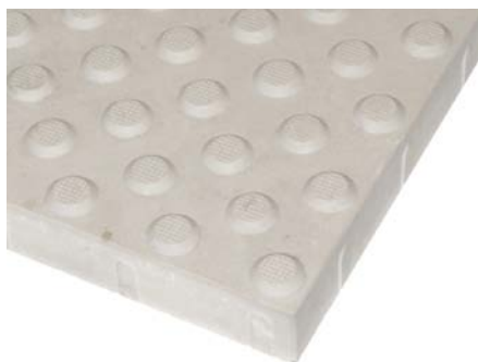
Rys. 1. Płytki ostrzegawcze - szczegóły powierzchni

Wymiary tolerancje wypustek płytki ostrzegawczej na podstawie normy DIN 32984 podano na rys. 2