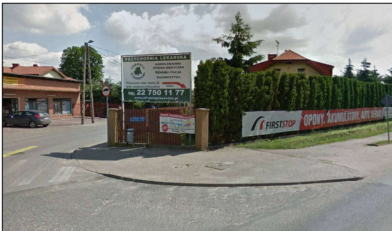
Fot. 2 (źródło: Google Earth)