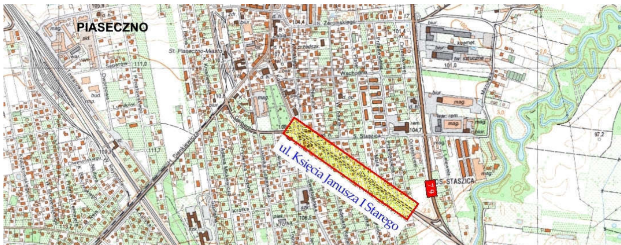
Rys. 1 – Lokalizacja inwestycji

Lokalizacja rozbudowywanej ulicy, w związku z którą zachodzi konieczność przebudowy przedmiotowego ogrodzenia, została przedstawiona na rysunku 1.