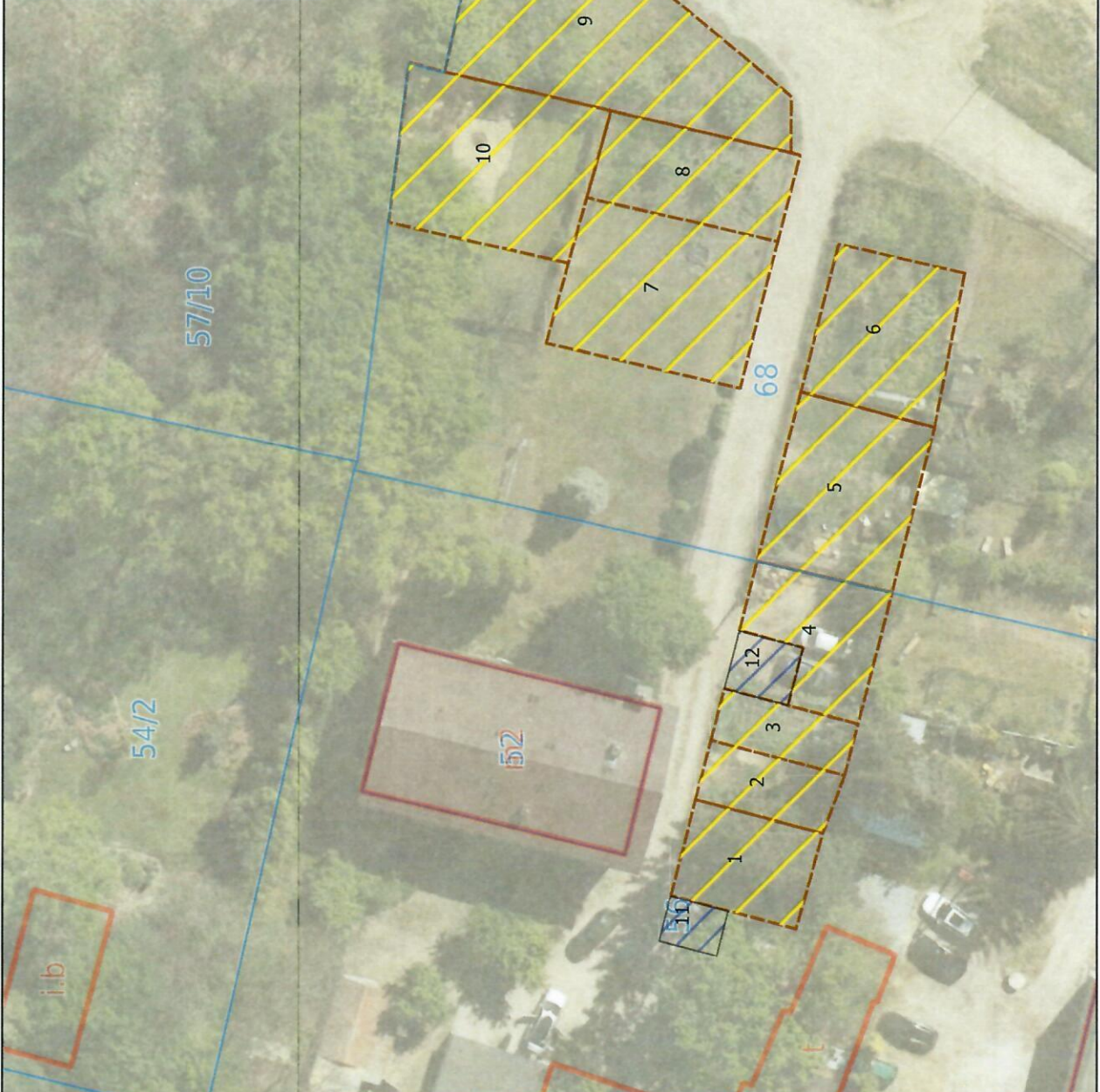
Tab.1. Powierzchnie obszarów do wydzierżawienia pod tereny zieleni i rekreacji