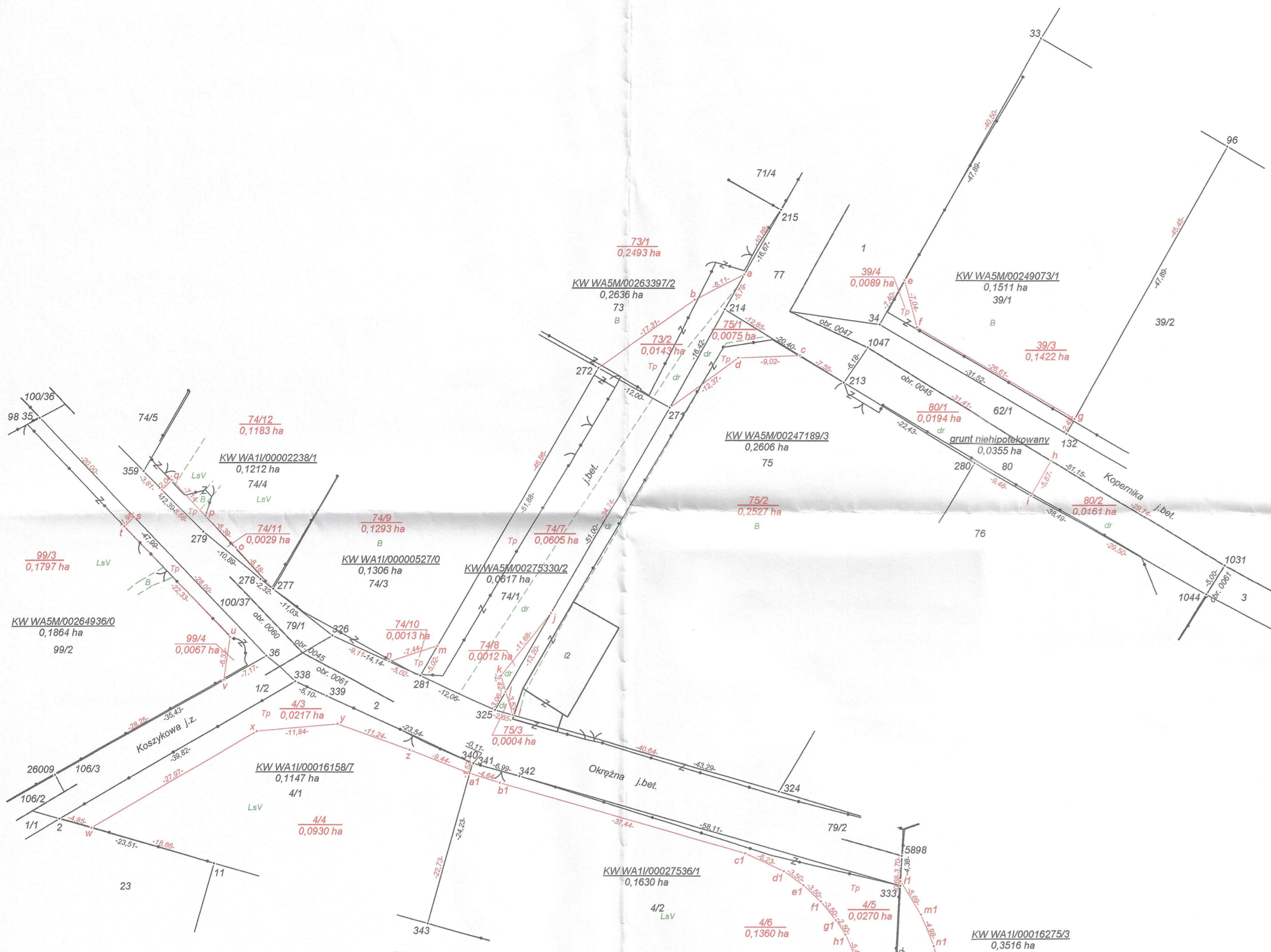
skala 1:500 Parcel 1: WSW-WA-100002632072, 0.2636 ha, 731, 0.2493 ha Parcel 2: WSW-WA-100002690731, 0.1511 ha, 381, 330, 0.1422 ha Parcel 3: WSW-WA-10000261882, 0.2606 ha, 75, 749, 0.1639 ha, 741, 0.0073 ha, 740, 0.0029 ha, 740, 0.0013 ha Parcel 4: WSW-WA-1000026366, 0.1854 ha, 99/2, 99/4, 0.0067 ha Parcel 5: WSW-WA-10000161587, 0.1147 ha, 4/1, 4/1, 0.0930 ha, 4/2, 4/2, 0.0210 ha, 4/2, 0.0132 ha Parcel 6: WSW-WA-10000162734, 0.3516 ha, 5, 4/1, 0.3354 ha Parcel 7: WSW-WA-10000088367, 0.1467 ha, 25, 25, 0.0000 ha, 25, 0.1458 ha, 25, 0.0000 ha