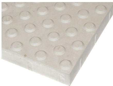
Rys. 1. Płytkę ostrzegawczą - szczegół powierzchni