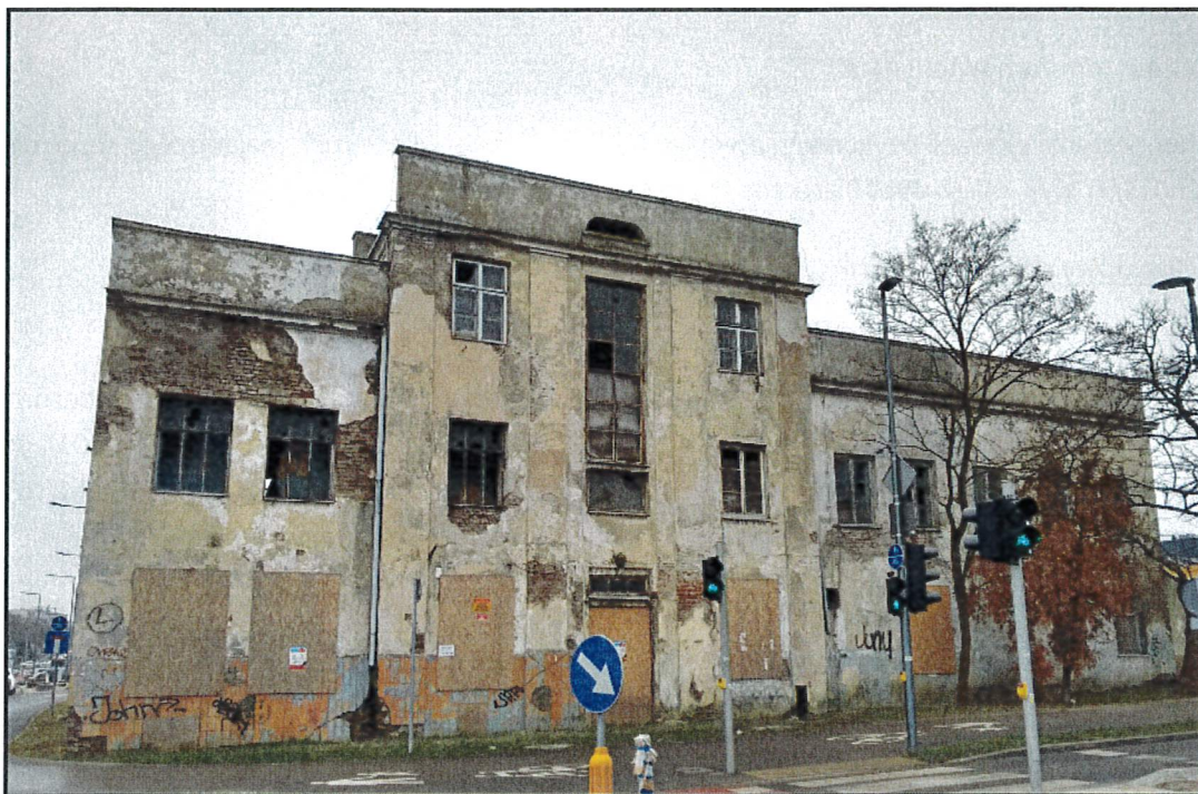
Fot. nr 1 Elewacja północna podlegająca zabezpieczeniu