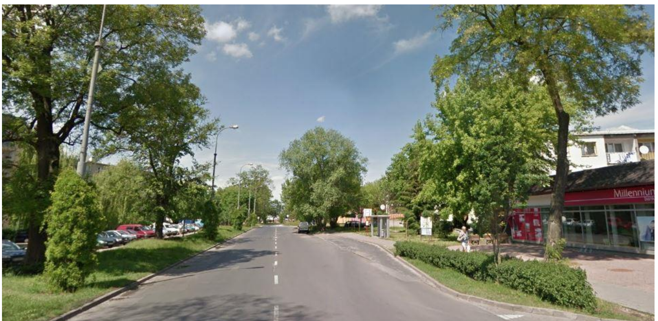
Fotografia nr 2 (ul. Puławska – rejon skrzyżowania z ul. Warszawską)