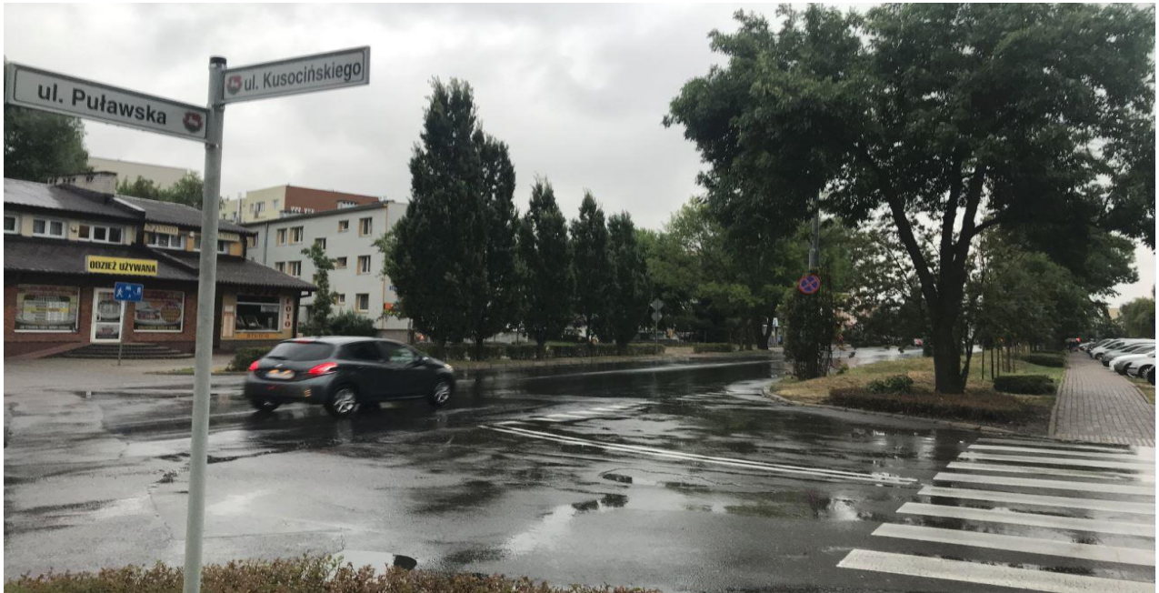
Fotografia nr 1 (ul. Puławska – rejon skrzyżowania z ul. Kusocińskiego)

Istniejące zagospodarowanie terenu przedstawiają następujące fotografie.