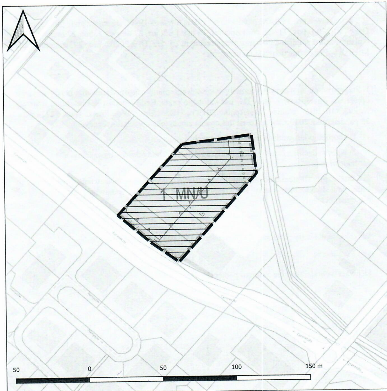
Orientacja na tle Gminy Piaseczno