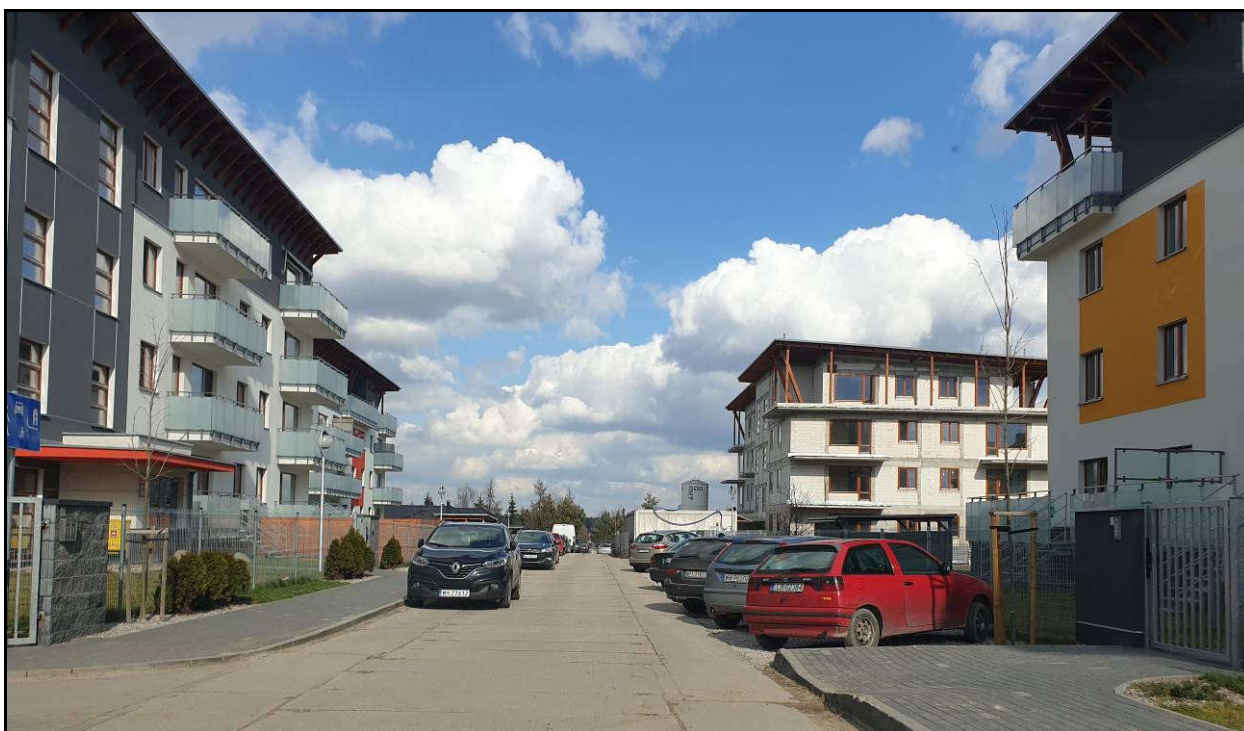
Fot. 2 – ul. Sybiraków w kierunku ul. Lidii Wysockiej (od południa)