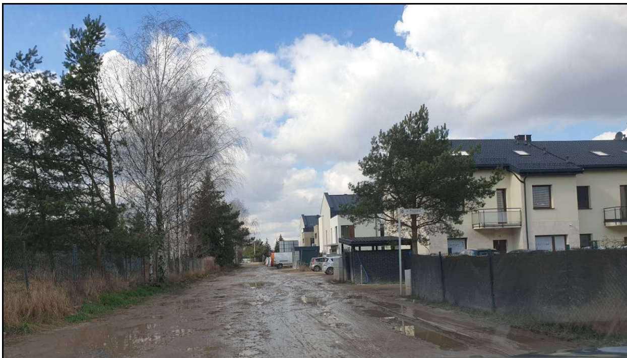
Fot. 1 – ul. Lidii Wysockiej w kierunku ul. Julianowskiej