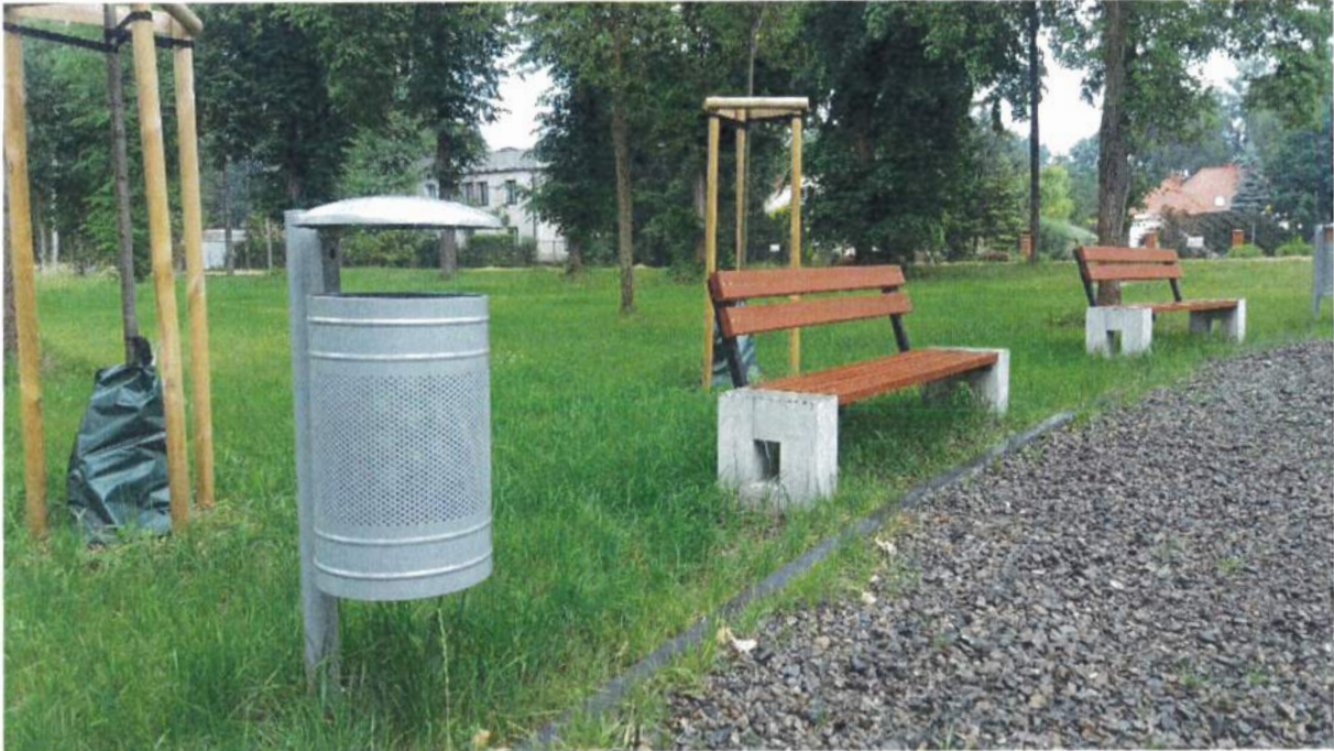
ZDJ. 1. Zdjęcie z palca sołeckiego, z dn. 25.06.2021