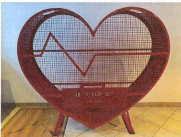
ZDJ. 3 Zdjęcie pojemnika na nakrętki

Sposób montażu – kotwy - mocowane poprzez wbetonowanie 45 cm w podłoże.