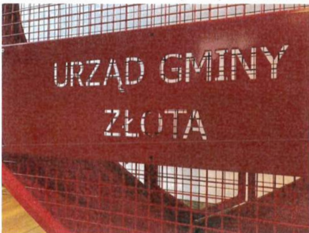
ZDJ.2 Przykładowy napis.

Napis „Gmina Piaseczno” -wycinany CNC w cenie