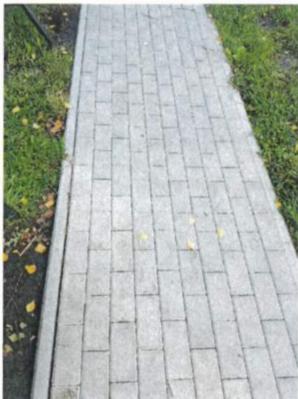
Nawierzchnia istniejąca stan 11.08.2021.