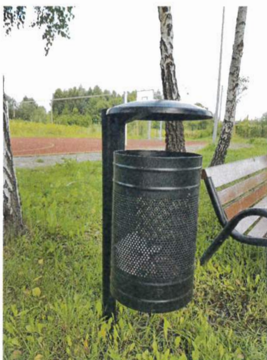
Zdjęcie małej architektury, stan na 11.08.2021r.

Sposób montażu – słupek z kotwą - mocowane poprzez wbetonowanie 45 cm słupka w podłoże.