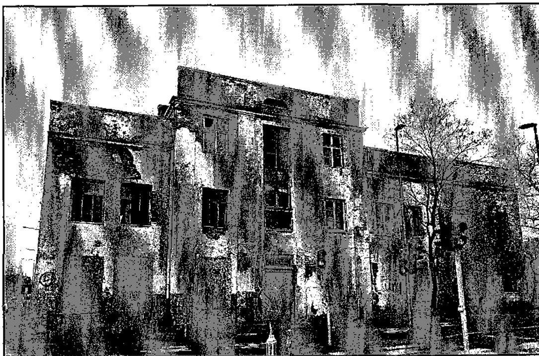
Fot. nr 1 Elewacja północna przedmiotowego obiektu