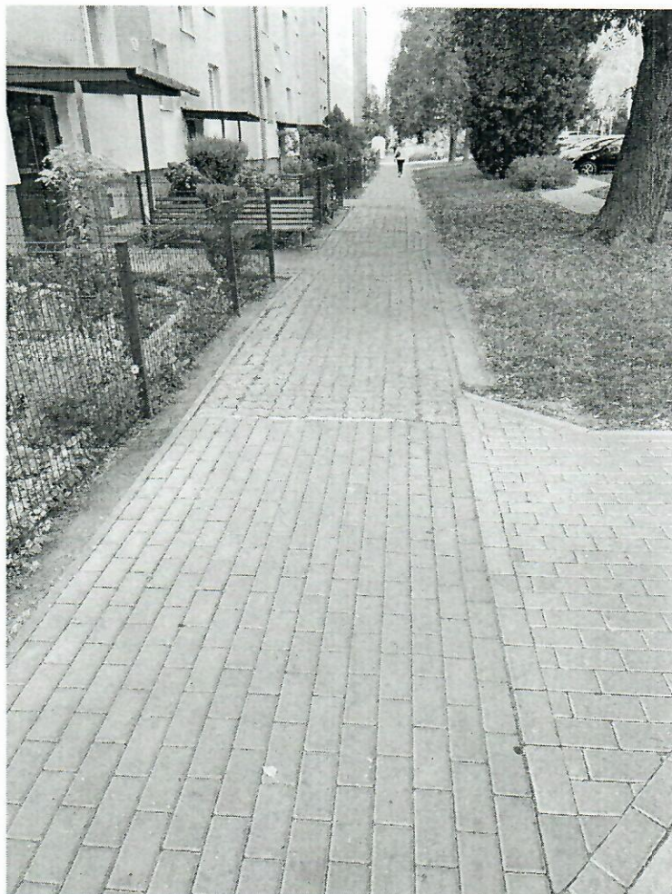
widok na szkolną 9 i dalej