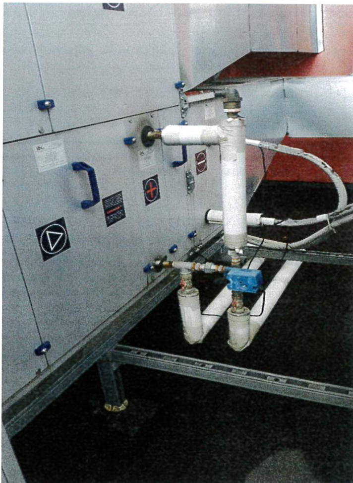
Zdjęcie stanu istniejącego: