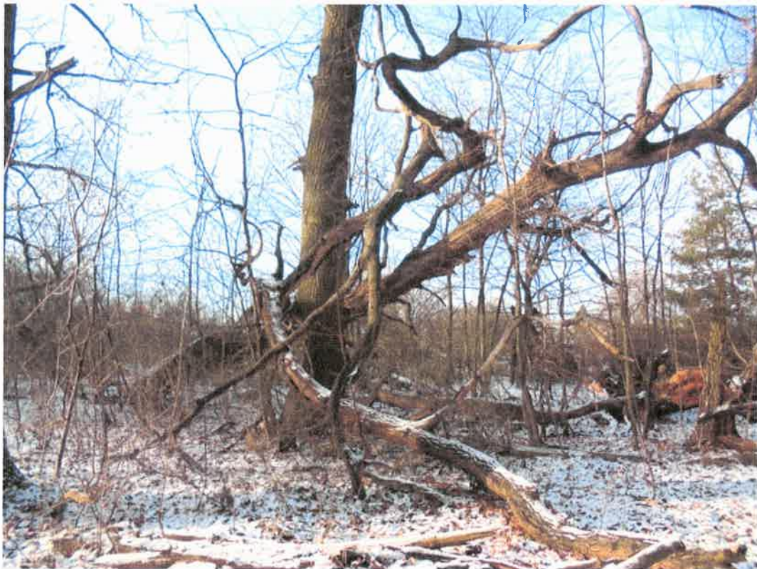
Fot. Pień drzewa