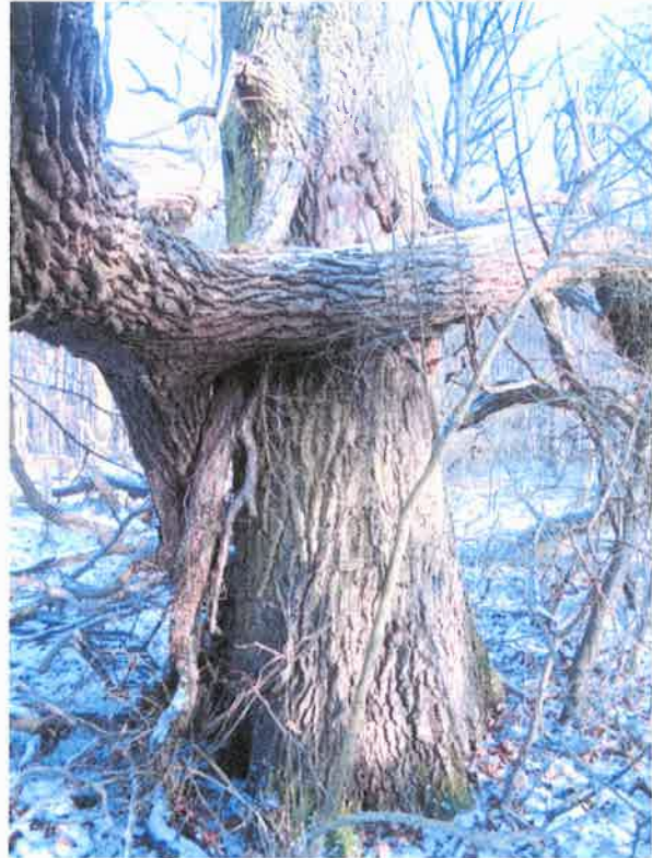
Fot. Pień drzewa z opartym martwym drzewem c