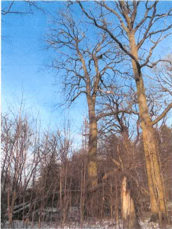
Fot. Pokrój drzewa