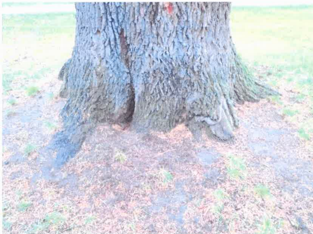
Odziomek drzewa z próchniejącym nabiegiem korzeniowym