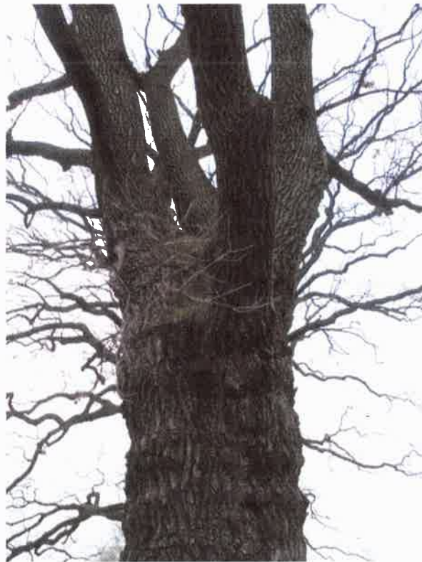
Nasada korony z dziuplą i ranami po obciętych konarach