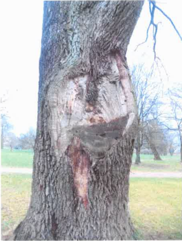
Rana na pniu po obciętych przewodniku