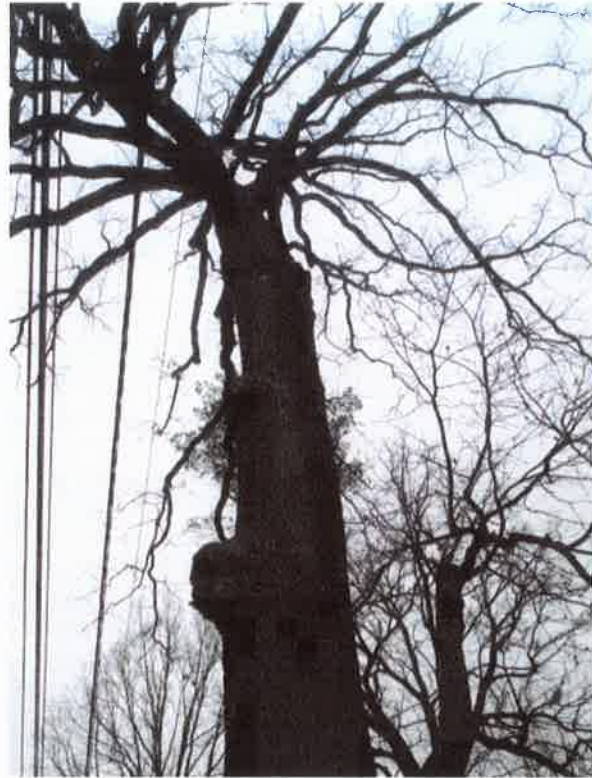
Pień i nasada korony z licznymi ranami po cięciach