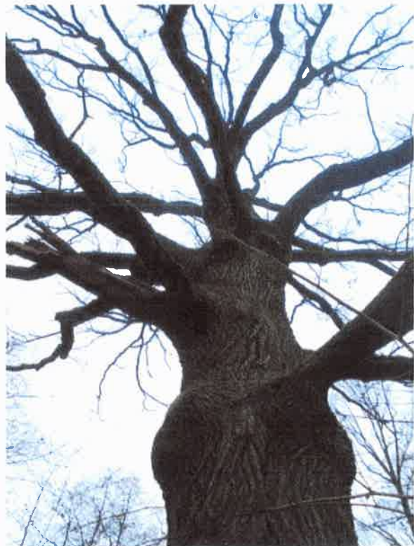
Rany po cięciach w nasadzie i w koronie drzewa