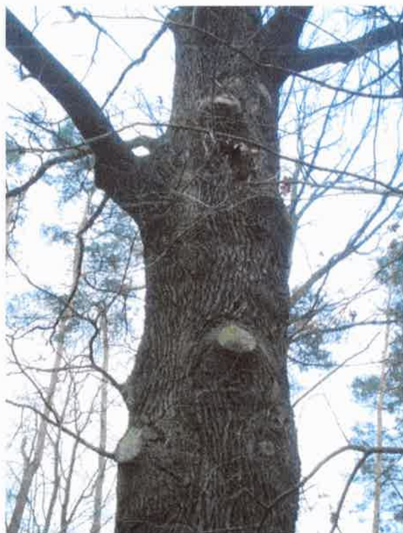
Zalewane i zalane rany po obciętych konarach