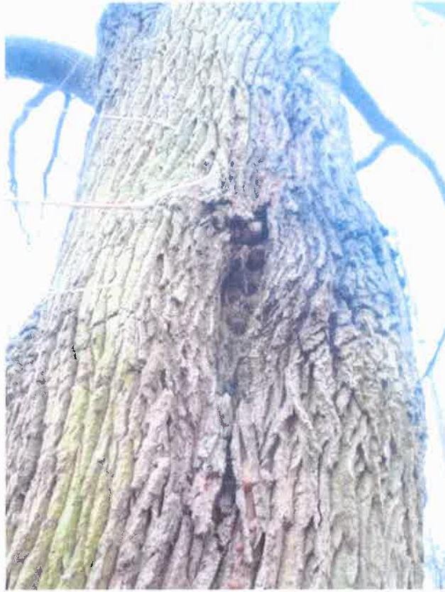
Rana na pniu