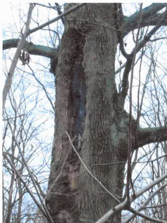
Rana po odłamanym przewodniku