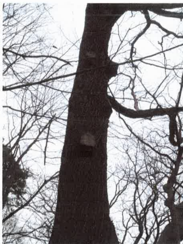
Pień drzewa z ranami po cięciach