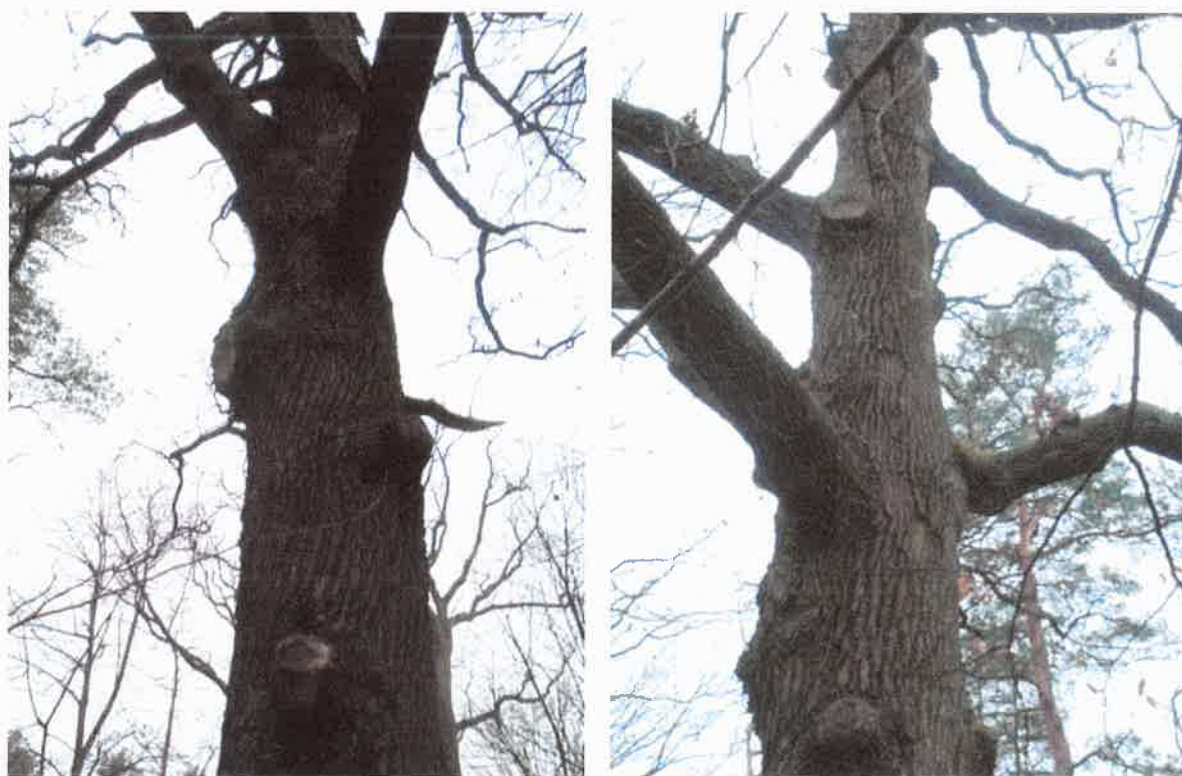
Pień i nasada korony z ranami po cięciach