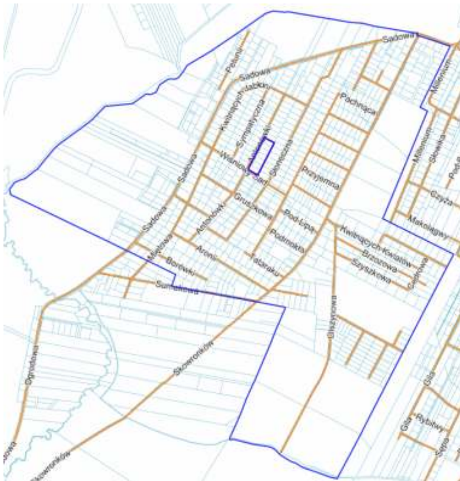
Rysunek 1. Granica opracowania prognozy oddziaływania na środowisko do miejscowego planu zagospodarowania przestrzennego wsi Baszkówka – etap I – teren usług publicznych na tle miejscowości Baszkówka

zajmuje powierzchnię ok. 0,78 ha. Badany teren tworzy siedem działek z przeznaczeniem pod teren usług publicznych