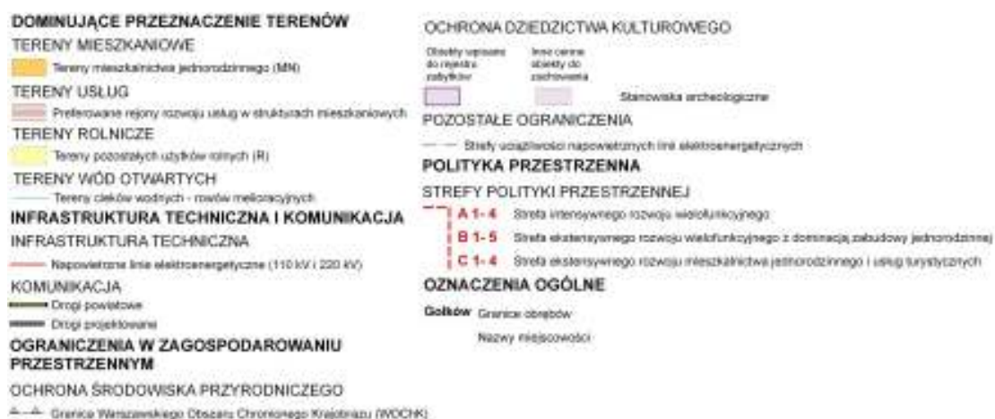
Rysunek 4. Wyrys ze studium z oznaczonymi granicami przedmiotowego planu (skala legendy nie została zachowana); źródło: Studium uwarunkowań i kierunków zagospodarowania przestrzennego miasta i gminy Piaseczno przyjęto uchwałą Rady Miejskiej w Piasecznie Nr 1589/LII/2014 z dnia 29 października 2014 roku