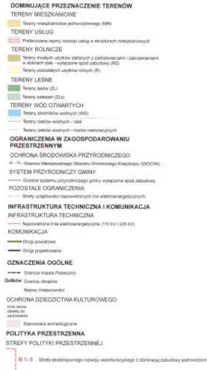
Rysunek 7. Wyrys ze studium z oznaczonymi granicami przedmiotowego planu (skala legendy nie została zachowana); źródło: Studium uwarunkowań i kierunków zagospodarowania przestrzennego miasta i gminy Piaseczno przyjęto uchwałą Rady Miejskiej w Piasecznie Nr 1589/LII/2014 z dnia 29 października 2014 roku