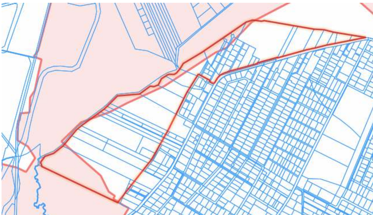
Rysunek 3 Granica krajobrazu priorytetowego na tle obszaru opracowania

Istotnym elementem znajdującym się na terenie opracowywanego planu jest krajobraz priorytetowy uwzględniony przez Audyt Krajobrazowy województwa mazowieckiego przyjęty uchwałą Sejmiku Województwa Mazowieckiego nr 48/24 z dnia 26 marca 2024 r.