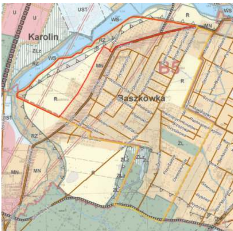
Rysunek 6. Obszar opracowywanego terenu wsi Baszkówka