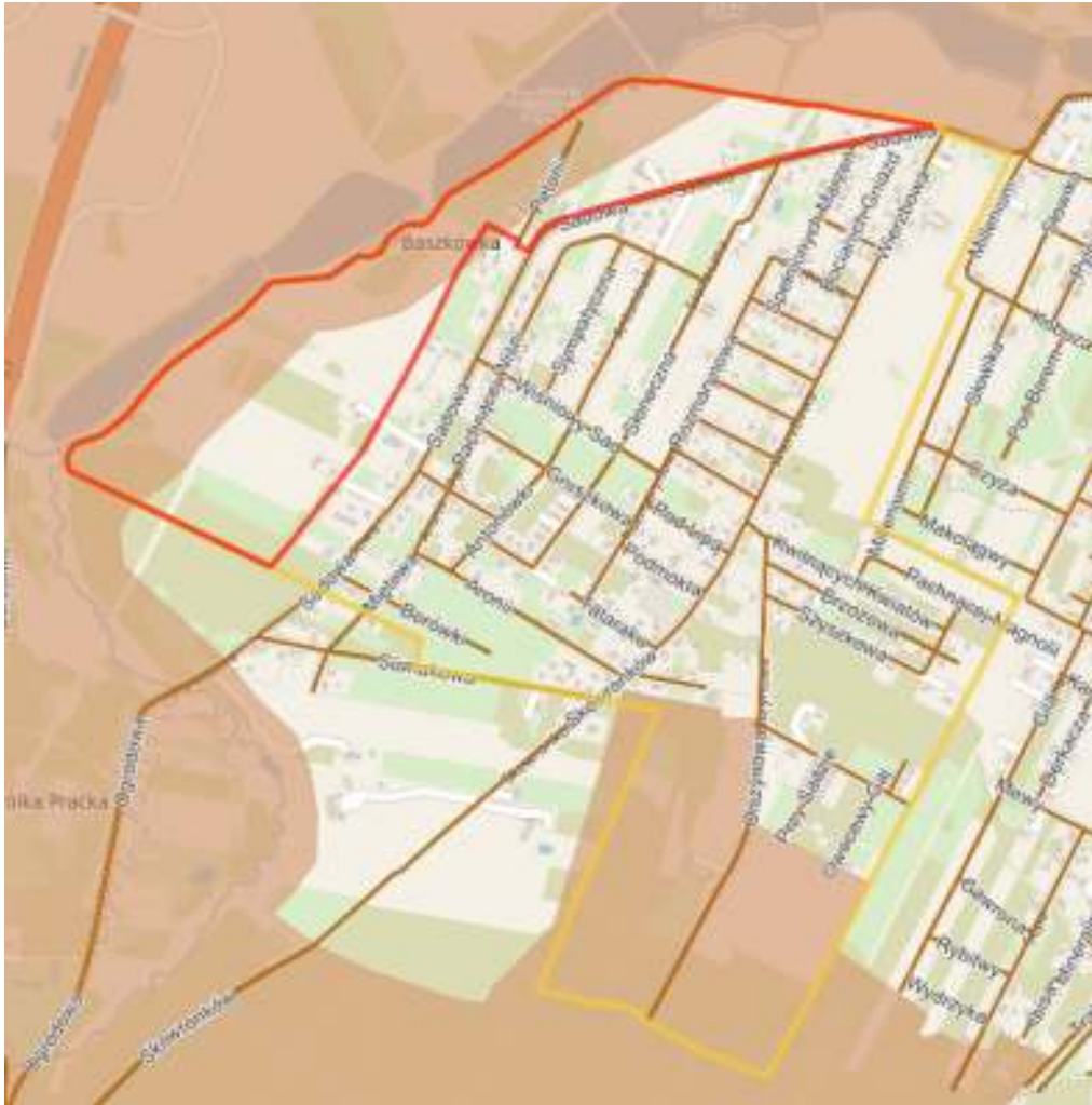
Rysunek 2. Lokalizacja opracowywanego planu na tle form ochrony przyrody - Warszawski Obszar Chronionego Krajobrazu

Znaczne odległości od istniejących obszarów Natura 2000 pozwalają na stwierdzenie, że obecne oraz planowane zagospodarowanie terenu nie będzie miało na nie znacznego wpływu. Nie prognozuje się szkodliwego oddziaływania wykraczającego poza granicę Polski.