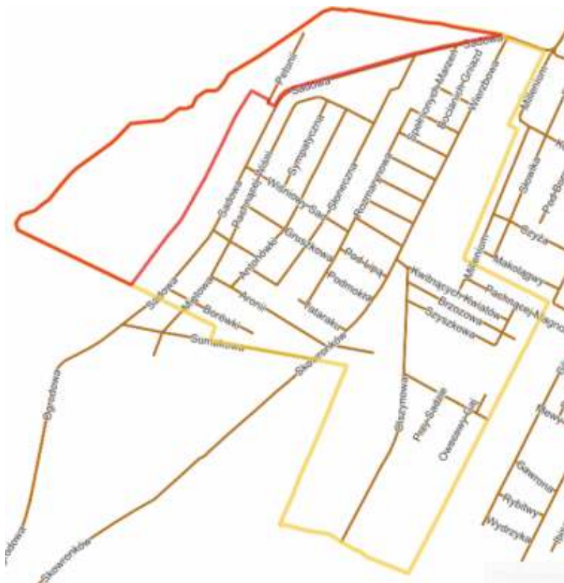
Rysunek 1. Granice opracowania prognozy oddziaływania na środowisko do miejscowego planu zagospodarowania przestrzennego wsi Baszkówka – etap II

miasta Piaseczno. Miejscowość Baszkówka ma ok. 200 ha powierzchni, natomiast analizowany obszar zajmuje łącznie powierzchnię ok. 41 ha. Dominującą funkcją planu są tereny rolne.