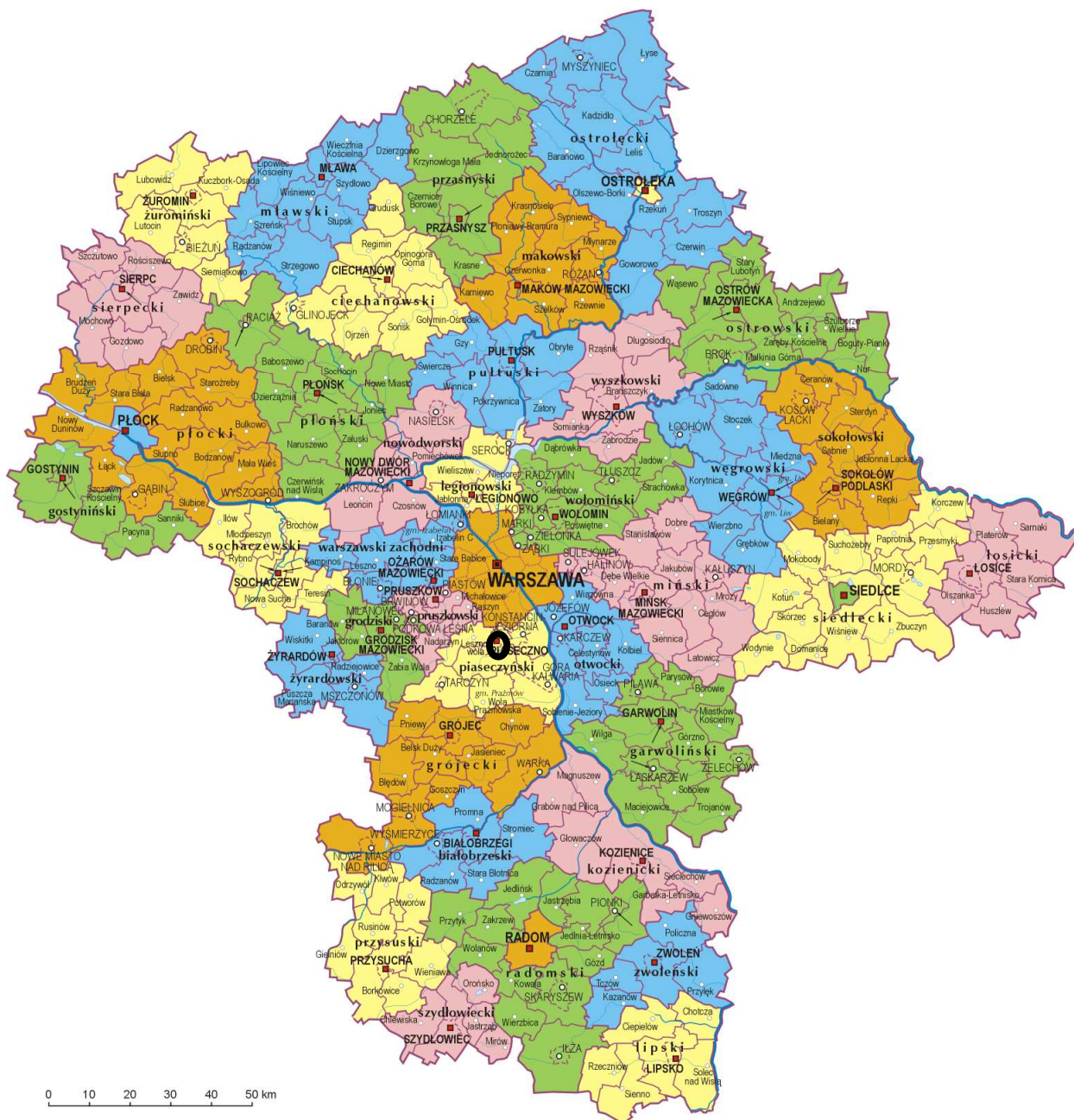
Rys.1. Lokalizacja Miasta i Gminy na tle województwa mazowieckiego.

Powierzchnia gminy wynosi 12 823 ha (co stanowi 20% powierzchni powiatu), w tym powierzchnia miasta Piaseczno wynosi 1 633 ha, a część wiejska – 11 190 ha. Gminę zamieszkuje wg danych z 30.09.2013 r. 70122 osób, z czego 40808 osób zamieszkuje miasto Piaseczno a 29314 osób mieszka na terenach wiejskich. Zgodnie z Studium uwarunkowań i kierunków zagospodarowania przestrzennego miasta i gminy Piaseczno gminę Piaseczno charakteryzuje rolniczo – przemysłowy typ zagospodarowania i duży stopień urbanizacji. W strukturze użytkowania gruntów gminy przeważają użytki rolne (51,7%), przy ok. 29,3% udziale lasów i gruntów leśnych. Pozostałe grunty i nieużytki stanowią blisko 19%.