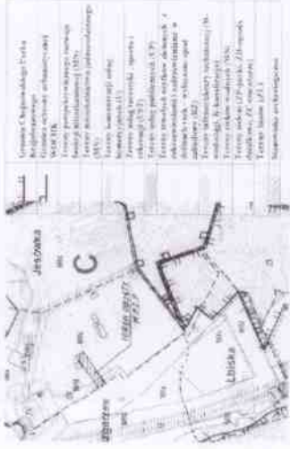
WORSZE STUDEM IARMIKOWSKA I LUBISKIENSKICH ZAGOSPODAROWANIA PRZESTRZENNEGO WSI WÓLKA ELEMENTY PLANU CZYJ. ADRES: 12 104 96