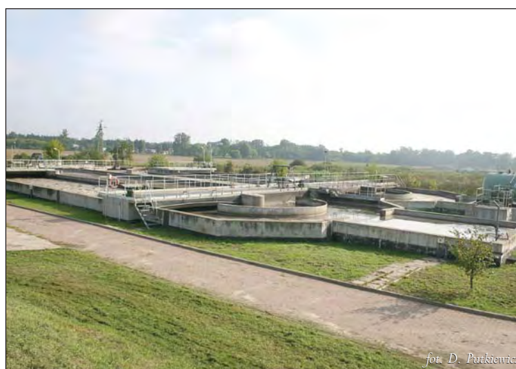
Miejska oczyszczalnia ścieków w Piasecznie przy ul. Zeromskiego

Unię Europejską w ramach Funduszu Spójności. Projekt ten przyczynia się do zmniejszenia różnic społecznych i gospodarczych pomiędzy obywatelami Unii Europejskiej. Na projekt składają się roboty budowlane w ramach zadań nr I, II, III i IV. Niesprzyjająca sytuacja na rynku budowlanym oraz wcześniejsze problemy z dostosowaniem prawodawstwa polskiego do unijnego doprowadziły do opóźnień w realizacji inwestycji. W lipcu 2006 roku przetarg nieograniczony na przebudowę i rozbudowę oczyszczalni ścieków został unieważniony, ponieważ potencjalni wykonawcy złożyli oferty cenowe przekraczające możliwości gminy. W grudniu ponownie rozpisano przetarg na przebudowę i rozbudowę oczyszczalni - zadanie I, oraz na rozbudowę oczyszczalni ścieków w Wólce Kozodawskiej, pompowni Ra-