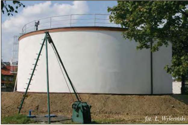
fol. L. Wyleziński