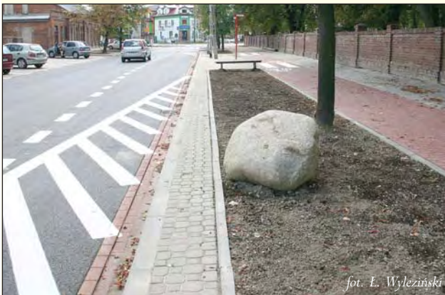
fol. L. Wyleziński