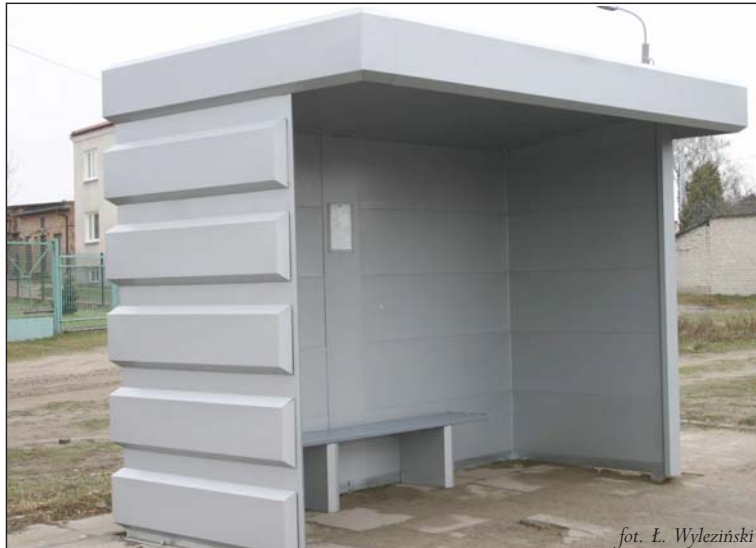
fol. L. Wyleziński

Gmina Piaseczno zakupiła 37 nowych wiat przystankowych, które ustawiane są na głównych przystankach autobusowych na terenach wiejskich.