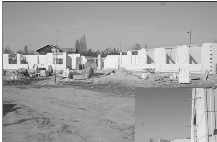
Zespół szkół powstaje przy ul. Kameralnej (d. Żwirowej)

więć sal lekcyjnych zlokalizowanych na I piętrze. Na parterze znajdują się szatnia, świetlica oraz stołówka z zapleczem kuchennym.