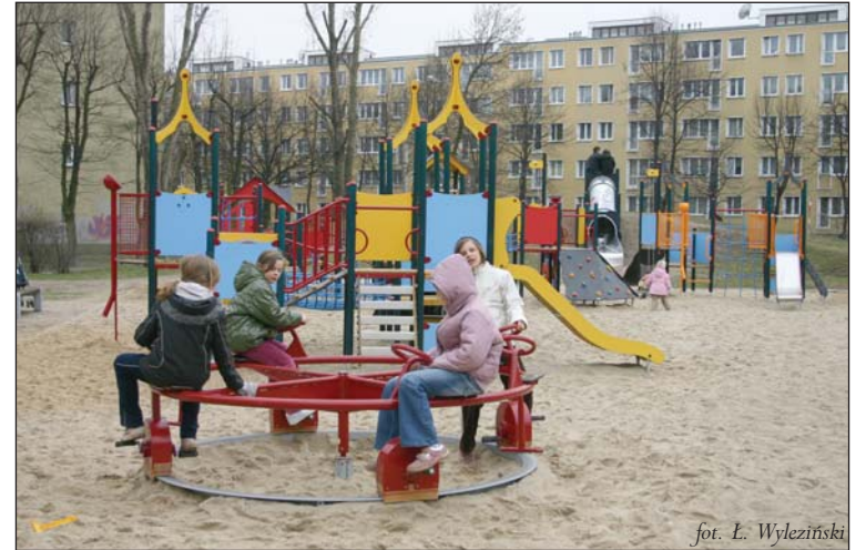
fol. L. Wyleziński

Szczególnie atrakcyjnie wyglądają zestawy zabawowe - urządzenia, po których dzieci mogą się wspinać, chodzić, huścić się, a także zjeżdżać ze zjeżdżałni. Jednocześnie z takiego urządzenia korzystać może kilkoro dzieci.