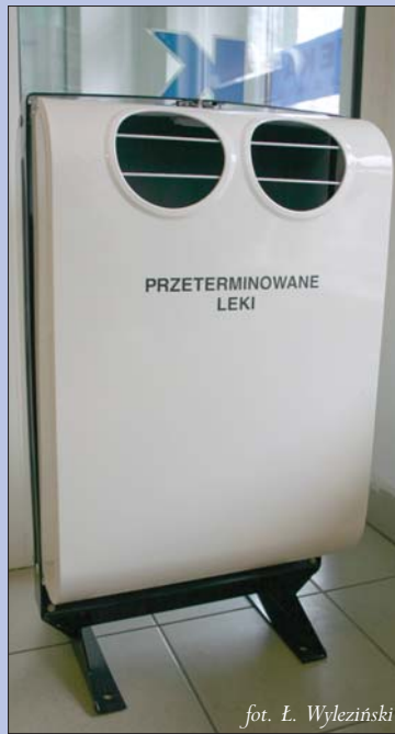
fol. L. Wyleziński

Uwaga! Prosimy, aby do pojemników nie wrzucać leków płynnych w butelkach, w celu wyeliminowania możliwości potłuczenia się szklanych opakowań.